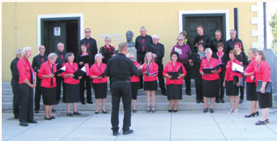
Združena zbora iz Beltinec in Monoštra