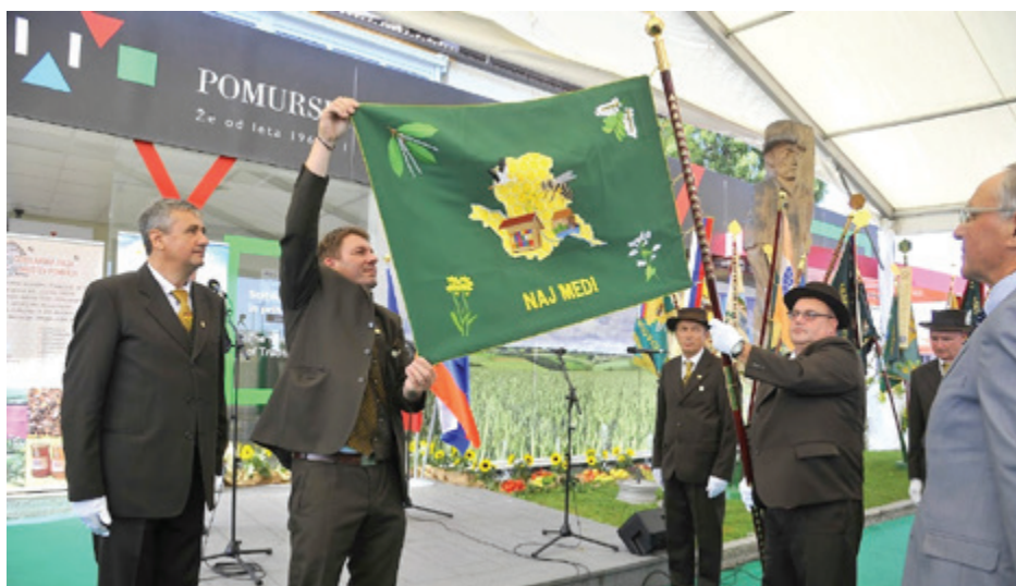
Razvitje prapora ČZ Pomurja / Agra - avgust 2021

mi, da Vas vse skupaj prav lepo pozdravim s čebelarškim pozdravom »Naj medi!«